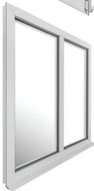
Vue extérieure ouvrant caché