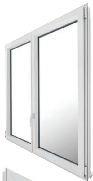
Vue intérieure finition galbée

Poignée Sécustik® : Toute manipulation de crémonne par l'extérieur, hors vitrage cassé, est rendue impossible grâce au mécanisme de verrouillage auto-bloquant. Les clics sonores émis lors de la manipulation garantissent la mise en place du système de sécurité.