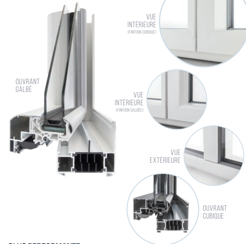
VUE INTÉRIEURE (FINITION CUBIQUE)